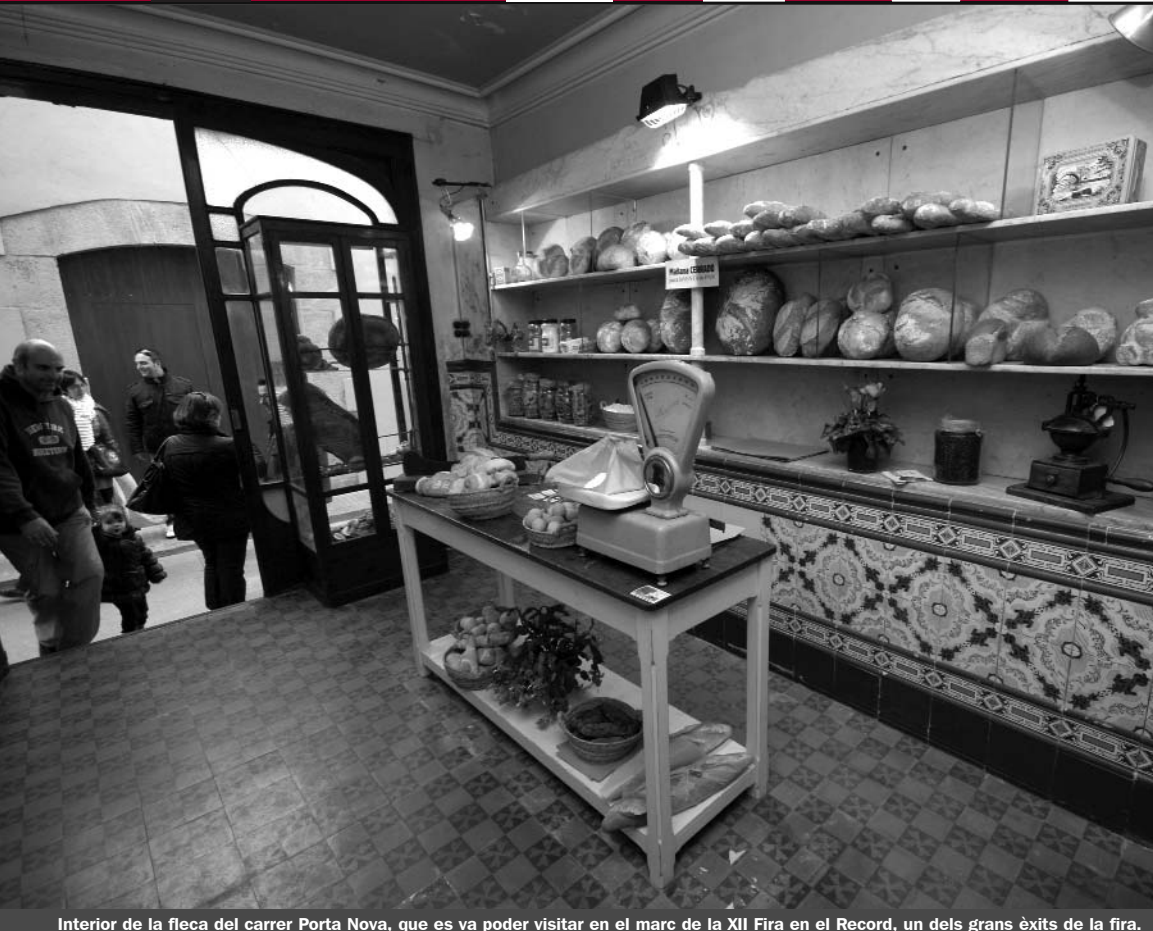
Interior de la fleca del carrer Porta Nova, que es va poder visitar en el marc de la XII Fira en el Record, un dels grans èxits de la fira.